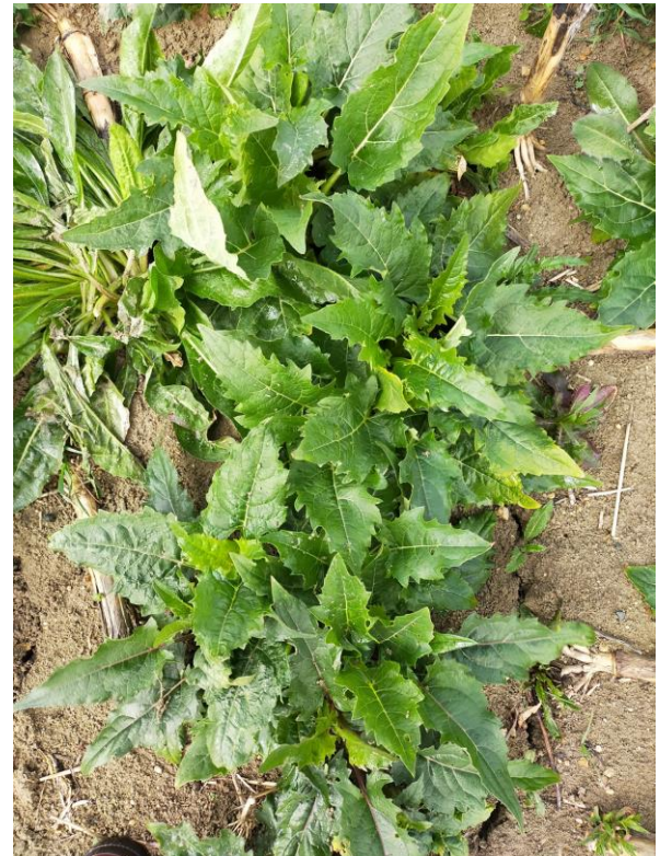
GAEC Petit Silphie au en mai 2021

Coût de semences : 2000 €/ha Rendement septembre 2022 : 4 TMS/ha.