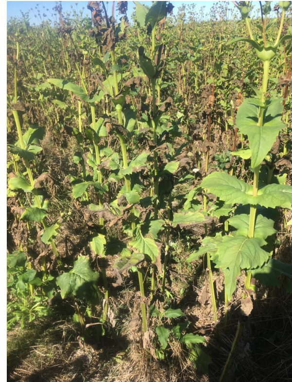
GAEC de la Gâche Silphie au 22/08/22

Rendement 2022 : 3 TMS/ha (sol argileux) et 6 TMS/ha en sols (limons).