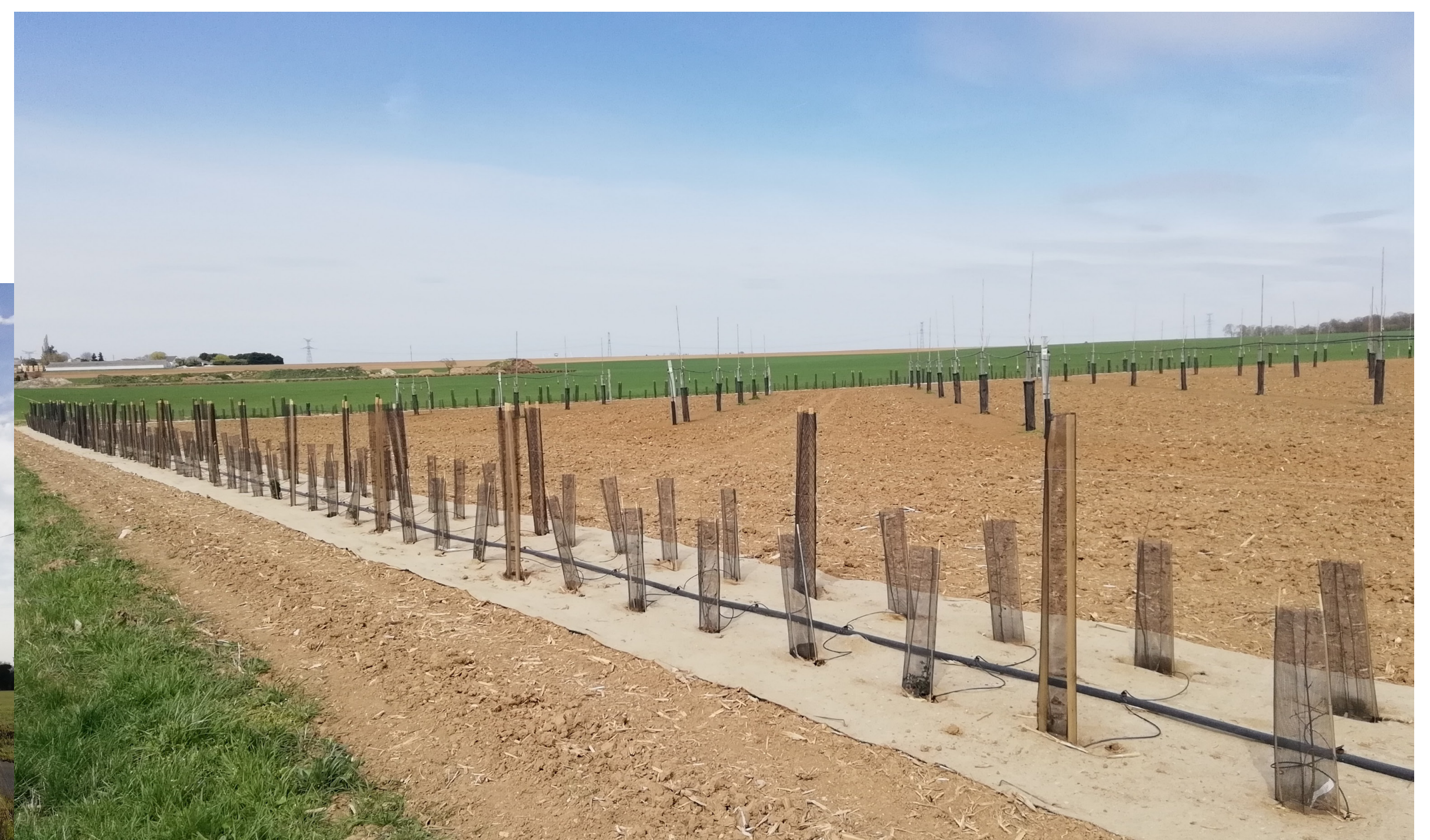
Haie champêtre – Loiret (45), 2022 Objectif : brise vent