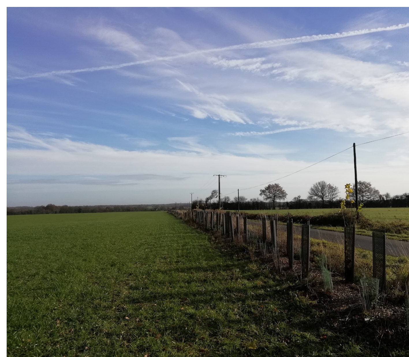
Haie champêtre – Loir et Cher (41), 2021 Objectif : production de biomasse

Comprenant : paillage, plants, protection, plantation