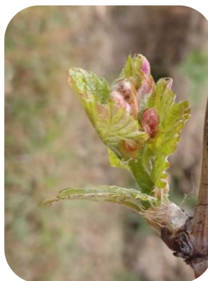
BM : Gamay - D08 « 1-2 feuilles étalées » - Val de Cher