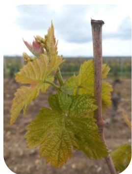
PG: Cabernet - D09 « 3-4 feuilles étalées » - St Nicolas de Bourgueil