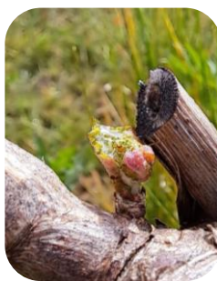
FR : Dégâts d'escargot sur sauvignon blanc