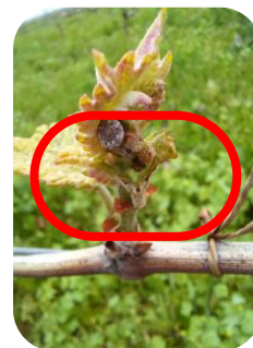
BM : Dégâts d'escargot – Floréal – Val de Cher