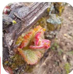
MT : Chenin - D07 « 1 ère feuille étalée » - Vernou-sur- brenne