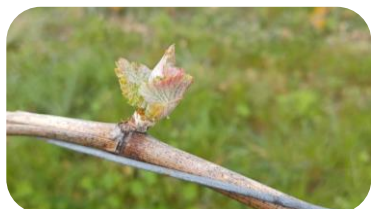
BM : Sauvignon - D07 « 1 ière feuille étalée » - Val de Cher