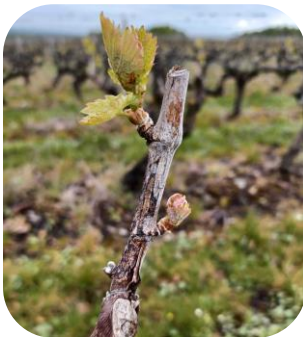
BM : Excoriose sur Gamay à corne - Meusnes

Nous observons très peu de symptômes d'excoriose sur le réseau. Cependant, l'inoculum peut rester disponible pour contaminer plus tardivement.