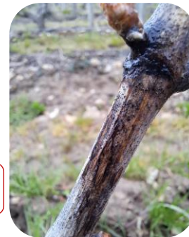
FR : Excoriose sur Chenin - Vernou-sur- Brenne