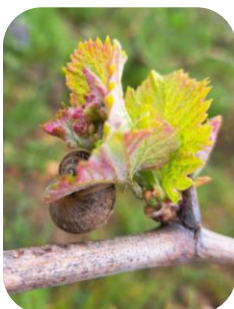
FR : Escargots sur jeune pousse de sauvignon blanc

Quelques escargots et dégâts ont été observés du fait des dernières pluies mais cela reste sporadique