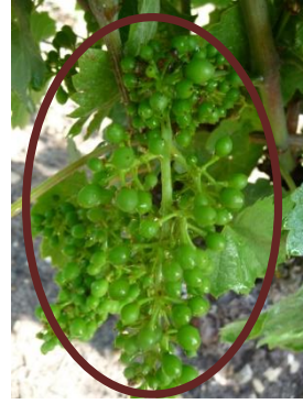
Gamay N 41