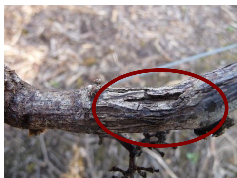
MB - Excoriose B 04 : «Chancres sur les bois de taille»

La propagation de la maladie se fait sur une courte distance (quelques dizaines de centimètres) à partir du vieux bois vers les rameaux en cours de croissance. Le champignon a besoin de conditions humides pour se développer et contaminer les pousses de l'année. Les symptômes apparaissent 7 à 21 jours après la contamination. La période de plus forte sensibilité de la vigne est très courte et s'étale du stade D (Sortie des feuilles) au stade E (Feuilles étalées) mais des contaminations peuvent encore avoir lieu jusqu'au stade F (7- 8 feuilles étalées) si les conditions climatiques sont favorables (fortes humectations)