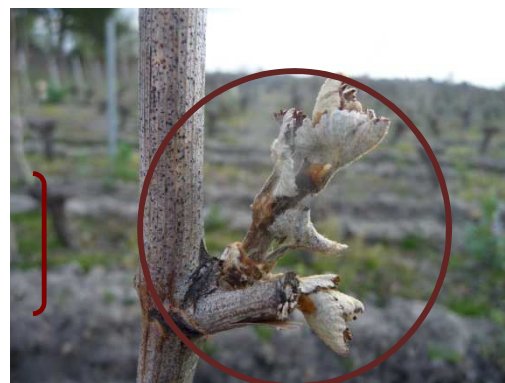
MB - Chenin 41 Bourgeons gelés 12/04/21» à Noyers/C