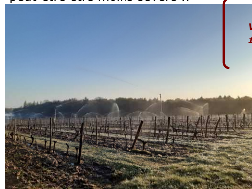
MB - Sauvignon 41 Vigne en aspersion anti gel 12/04/21» à Cour Cheverny

Dans des situations où les vignes ne sont qu'au stade gonflement du bourgeon (Sauvignon, Cot ..) l'impact devrait peut-être être moins sévère ..