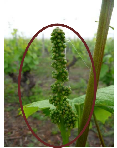
Sauvignon (MB -41)