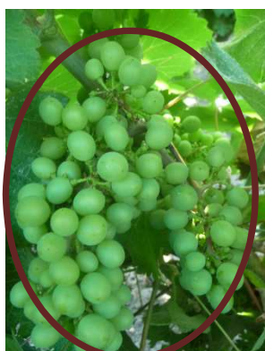
Chenin 41 (MB)