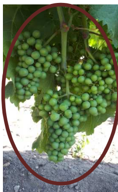
Cabernet Franc 37 (AM)