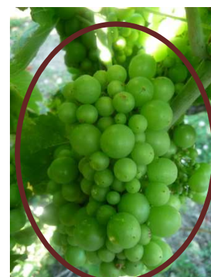
Gamay 41 (MB)

En 2018, les 1ères baies vérées avaient été observées vers le 20/22 juillet