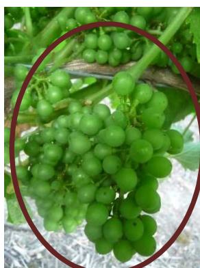
Sauvignon 41 (MB)