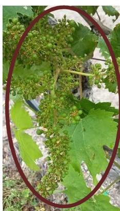
Cabernet 37 (JF)