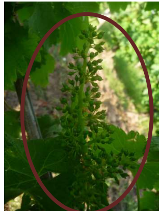
Sauvignon 41 (MB)