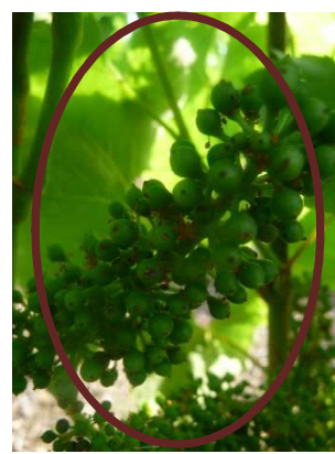
Gamay 41 (MB)