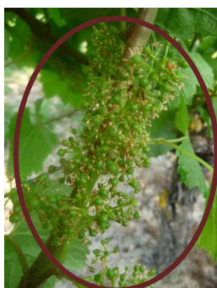
Chardonnay 41 (MB)