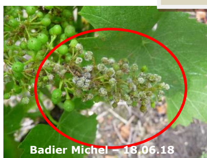
Mildiou sur TNT – 41.06 Sauvignon

Rappel : A partir du stade fermeture de la grappe (qui devrait être atteint à partir de la semaine prochaine), les grappes deviennent moins sensibles au mildiou.