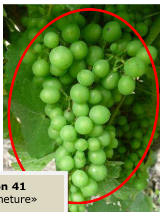
Sauvignon 41 L 33 « Fermeture»