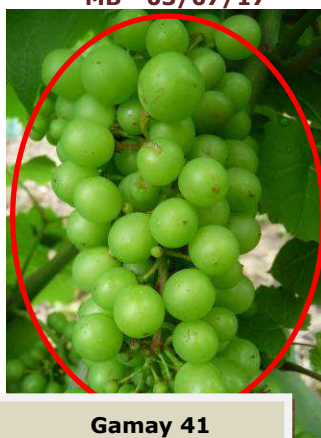
Gamay 41 L 33 « Fermeture»