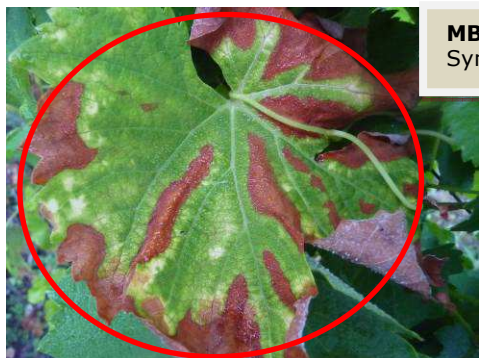
MB – ESCA/BDA – 03/07/17 Symptômes caractéristiques sur feuilles

Les symptômes commencent à être observés sur les parcelles du réseau mais cela reste encore assez limité dans la majorité des situations sauf sur la partie Est du vignoble où il a été observé une « explosion » des symptômes, dû notamment aux fortes chaleurs de la période du 15/23 juin.