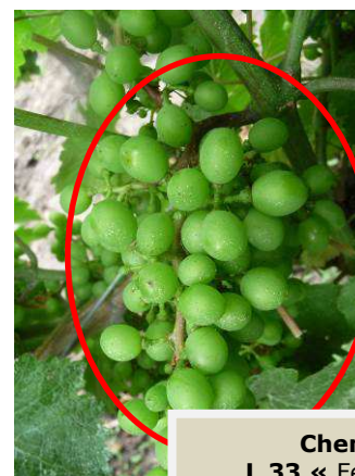
Chenin 41 L 33 « Fermeture»

Commentaires : L'ensemble des cépages se trouve tous au stade L 33 « fermeture »