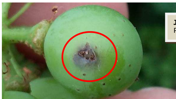
JF – 1 ères éclosions de cochylis – 03/07/17 Parcelle hors réseau – Savigny en Veron

Les 1 ères pontes ont été observées la semaine dernière mais elles restent limitées.