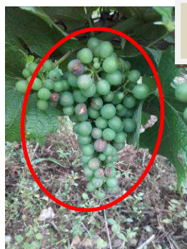
PB - impacts de grêle Meusnes(41) et Lye (36)