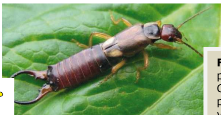
Forficule ou perce oreille : un auxiliaire présent au vignoble. C'est est un auxiliaire, connu comme prédateur d'œufs et de jeunes chenilles de vers de la grappe