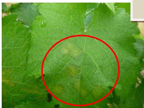
MB. 12.06.17 Mildiou sur feuille sur TNT à Oisly