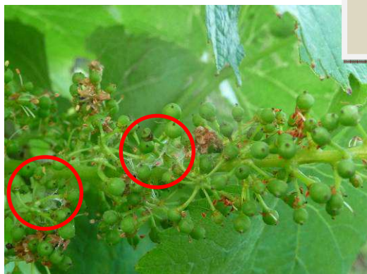
MB. 12.06.17 Soies de tordeuses bien visibles