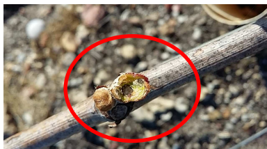
JF - 18/04/16

Rappel du seuil d'intervention : au moins 10 à 15 % des ceps avec au moins un bourgeon attaqué