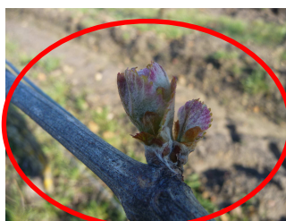
MB – 18/04/2016 Sauvignon « Eclatement du bourgeon »