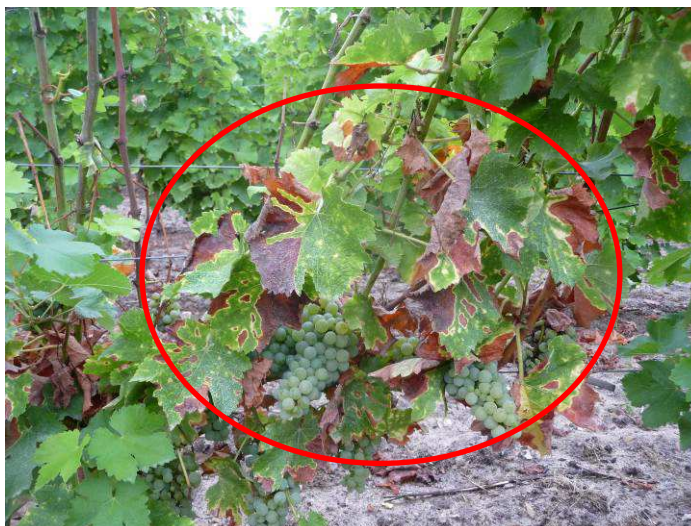
Forme apoplexie ESCA (MB - 19/09/16)

La maladie est très présente sur l'ensemble du vignoble sur tous les cépages (peut être à l'exception du Cot), et elle est aussi virulente qu'en 2014 et 2013