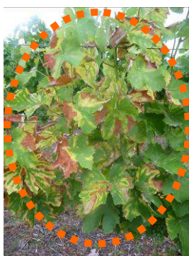
MB - 03/07/15 - Esca sur Sauvignon

De nouveaux symptômes sont observables depuis 15 jours et ils restent globalement encore « assez limités » aujourd'hui. Cependant dans certaines parcelles notamment de Sauvignon de 10 à 15 ans, le nombre de souches atteintes est déjà important.