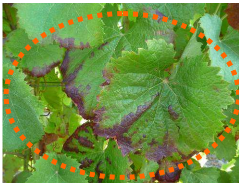
MB -03/08/15 - Grillures dues aux Cicadelles vertes sur Cot

Rappel du seuil de nuisibilité : 100 larves pour 100 feuilles observées.