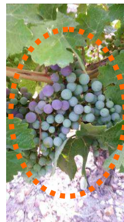
JF - Cabernet (Chinon 37)

03/08/2015 - stade L 35 «Début véraison»