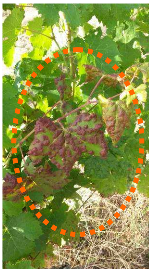
JF - 03/08/15 - Erinose sur Cabernet

Des symptômes d'Erinose sur feuilles sont observables sur parcelles du réseau et hors parcelles réseau