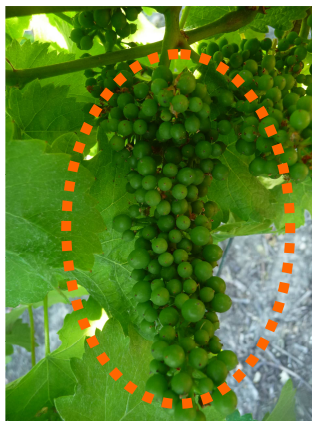
MB - 29/06/2015 Gamay N - stade K 32 «grains 5 à 6mm»