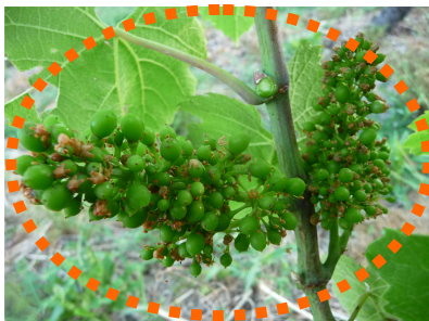
MB - 22/06/2015 Gamay N J 30 «grains 3 à 4mm»