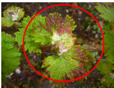
MB – 05/05/15 Erinose sur Sauvignon

Cependant cela n'aura aucune incidence sur le développement ultérieur de la vigne.