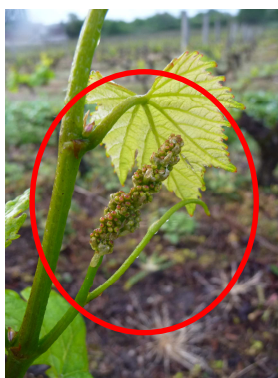
MB - 04/05/2015

Chardonnay F12 « 5 à 6 feuilles étalées - grappes visibles »