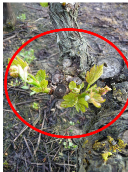
MB – 04/05/15 Eutypiose sur Sauvignon

Les 1ers symptômes d'Eutypiose commencent à être visibles.