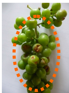
MB - impact de grêle du 19/07/15 - Sassay (41)