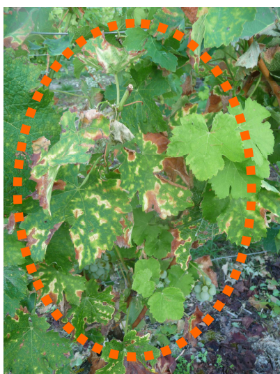
Forme lente (MB - 07/09/15)

Par contre, nous avons observé dans un certain nombre de parcelles, des symptômes sous forme de ponctuations - voir photo droite