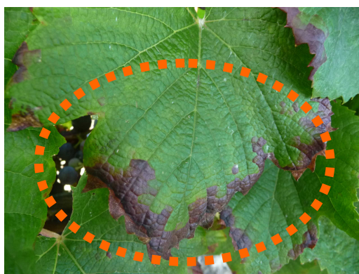
MB - 01/09/15 - Grillures / Cicadelles vertes sur Cot

Peu de symptômes globalement observés (décolorations et marbrures) en fin de saison sauf sur cépages sensibles notamment de Cot ou des parcelles conduites en cultures biologiques ou des parcelles en confusion sexuelle.