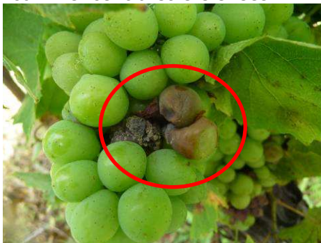
MB 28/07/14 Botrytis sur gamay

Hors parcelles réseau : Les symptômes sur grappes commencent à être également régulièrement observés et avec des intensités qui commencent à être élevées