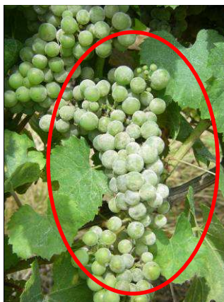
AR 28/07/14 Oïdium sur Chardonnay

Hors parcelles réseau : Des symptômes sur grappes commencent à être bien observés sur Chardonnay, Cabernet, Chenin et Pinot Noir notamment sur des parcelles sensibles de Chinon à Sancerre en passant par la Touraine.