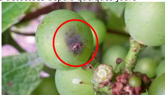
JF - 15/07/14 « Perforation »