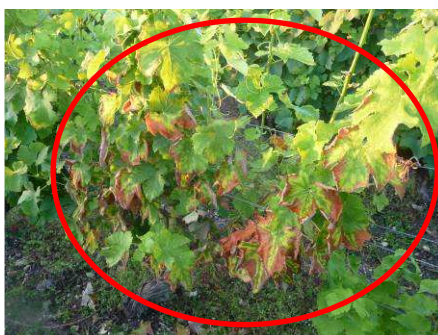
MB -15/07/14 Esca sur Sauvignon

Les conditions météo actuelles sont encore défavorables à l'extériorisation des symptômes