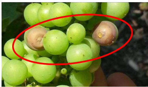
JF - 15/07/14

Des symptômes sont visibles sur grains sur des parcelles à historique.