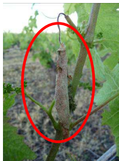
MB – 19/05/14 Cigarier : «Cigare»

Quasi absence d'observation de cigariers sur les parcelles sur réseau