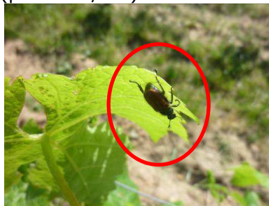
TC – 19/05/14

Les adultes sont sans danger pour la vigne mais les larves (vers blancs) pourraient l'être si leurs nombres en terre étaient importants (plusieurs/m 2 )