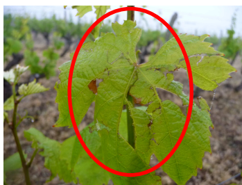
MB 26/05/14 Grêle sur feuille à Noyers(41)

Bulletin rédigé par Michel BADIÉ - CDA 41 en collaboration avec le comité de rédaction.