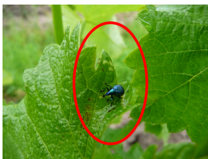
MB – 26/05/14 Cigarier en « balade »

Quasi absence d'observation de cigariers sur les parcelles sur réseau