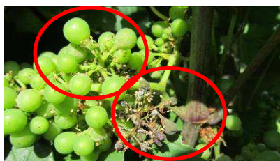
MT -Oïdium et Rot gris 21/07/13

Hors parcelles réseau : Peu ou pas de symptômes sur feuillage ou grappes observés sur le vignoble hormis quelques situation sporadiques à l'est du vignoble.