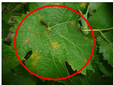
MB - Mildiou sur Sauvignon Cheverny 21/07/13