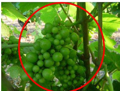
MB -22/07/13 Gamay N – K 33 « Début fermeture »