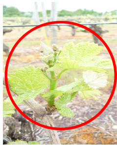
MB - 13/05/13

Sauvignon au stade E 09 « 3 à 4 feuilles étalées »