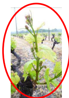
MB - 21/05/13