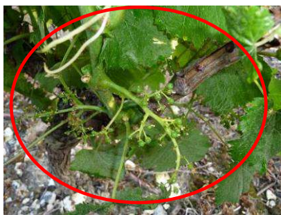
MB - coulure sur cépage Cot - 02/07/12