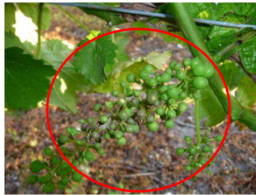
MB - Mildiou sur grappe de Gamay sur Témoin Non Traité - 02/07/12

Hors réseau, de nombreuses parcelles présentent également une nouvelle sortie des taches sur feuilles sur l'ensemble du vignoble notamment sur Cravant/Bourgueil (37) voire sur grappes sur certaines parcelles. Peu de zones actuellement sont épargnées.