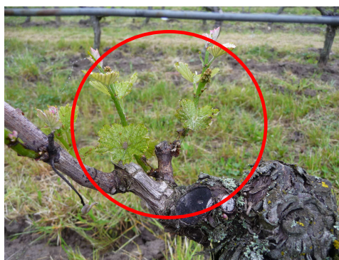
MB – Eutypiose – 22/05/12

Les 1ers symptômes d'Eutypiose commencent à être visibles.