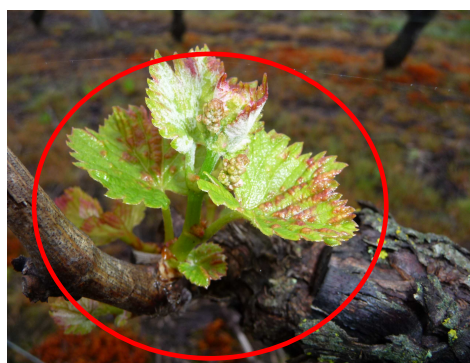
MB - Erinose sur Sauvignon – 21/05/12

Cependant, cela n'aura aucune incidence sur le développement de la vigne.