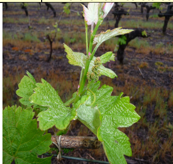
MB – Sauvignon – stade F12 – 22/05/12