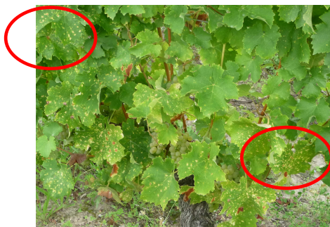
MB - 01/09/11

2 - Sur Cabernet notamment à l'ouest du réseau (Chinon, Bourgueil ...), sur de nombreuses parcelles il est signalé une recrudescence de symptômes que se soit en forme lente et/ou foudroyante.