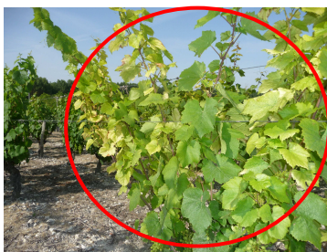
Chlorose sur Gamay à Noyers - 26/06/11 - MB

Les 1ers symptômes de chlorose sont visibles dans le vignoble sur les sols calcaires.