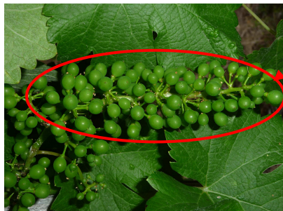
Sauvignon B - 41- 14/06/11 - MB

Les conditions climatiques des dernières semaines sont toujours très favorables au développement de la vigne. Pour les cépages précoces, certaines parcelles peuvent être déjà au stade : «31 à 33 - Petits pois à début fermeture ».