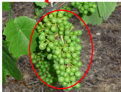
Gamay N - 41- 14/06/11 MB