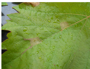
Black Rot - 2010 (ACK)