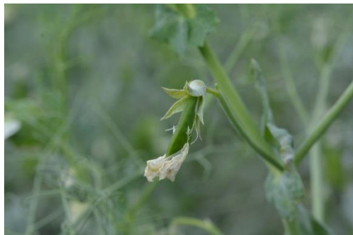
L. JUNG - CETIOM

Le stade JG2CM correspond à l'apparition des premières gousses. Elles mesurent 2 cm de long. Ce stade marque le début de la sensibilité du pois à la bruche du pois et à la tordeuse, et de la féverole à la bruche de la fève.