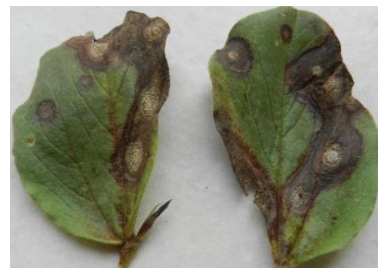
A.MOUSSART - CETIOM