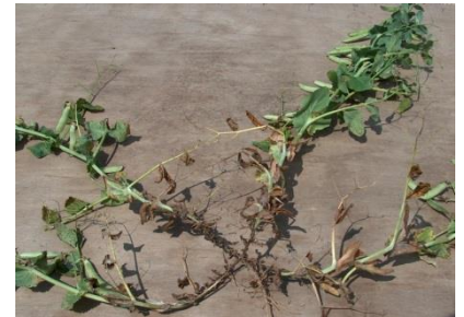
A.MOUSSART - CETIOM