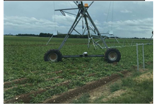
Parcelle grêlée dans le secteur le Bonneval

Des épisodes orageux violents accompagnés de fortes pluies et de grêle occasionnant des dégâts ont été enregistré entre samedi dernier et ces derniers jours, notamment en Eure et Loir, sur le secteur de Bonneval.