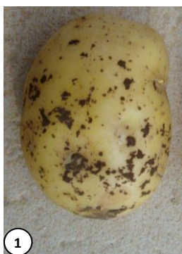
Photo 1 : Sclérotose de rhizoctone brun

Ce champignon altère la présentation des pommes de terre en formant des sclérotose noirs sur l'épiderme. En cas de forte contamination des plants, des problèmes de levée peuvent être observés surtout quand les conditions climatiques sont froides et humides et le plant mal préparé. En attaque plus tardive, un manchon de mycélium blanchâtre peut apparaître à la base des tiges et des tubercules aériens peuvent se développer à l'aisselle des feuilles.