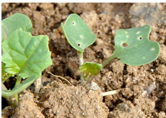
Moins de 25 % de la surface touchée

→ 8 pieds sur 10 portants des morsures. Il ne faut pas dépasser plus \frac{1}{4} de la surface végétative détruite. Au-delà du nombre de plantes avec dégâts, il est important de déterminer la surface végétative endommagée. En cas de levée tardive (après le 1er octobre), la vitesse de développement des colzas est ralentie et le seuil peut être abaissé à 3 plantes avec morsures sur 10.