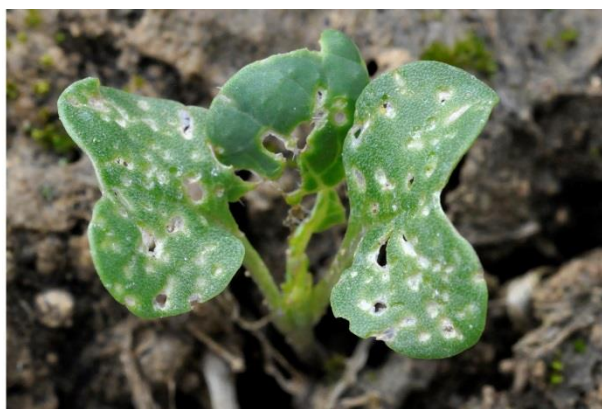
Plus de 25 % de la surface touchée