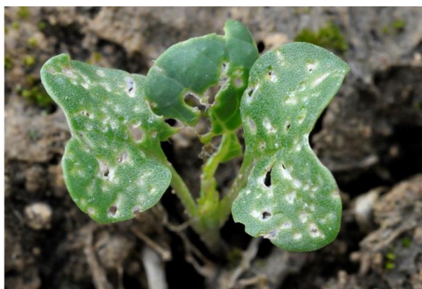
Plus de 25 % de la surface touchée