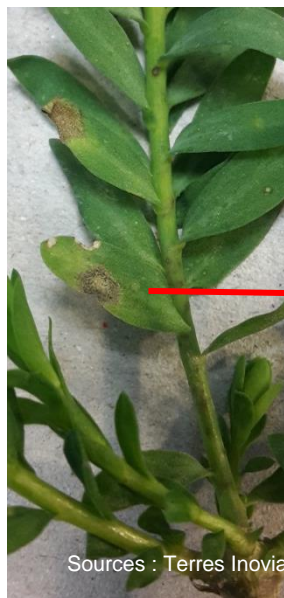
Photos : Symptômes de septoriose sur parcelle BSV en Ille et Vilaine (35) au mois de janvier 2016.

100 % des parcelles sont en dehors de la période de risque (floraison débutée) vis-à-vis de la septoriose. Le risque est pour l'instant faible. Compte tenu du contexte actuel, la surveillance doit se poursuivre. Surveillez l'apparition et l'évolution des symptômes dans les parcelles.