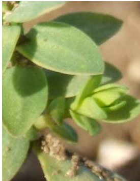
Stade C1 (BBCH 21) et C2 (BBCH 22) : apparition des premières ramifications basales