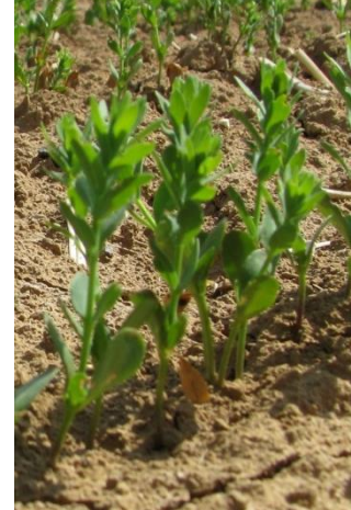
Stade B9 (BBCH 17) : 7 cm