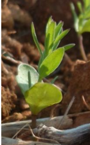
Stade B5 (BBCH 15) : 5 cm