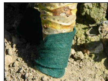
Feutrine posée sur trognon de chou.

Un seuil indicatif de risque découle de ce mode de piégeage.