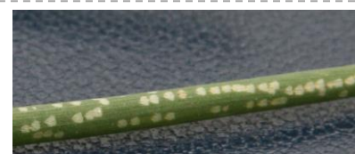
Piqûres de nutrition sur ciboulette (Photo CA41)

L'activité de nutrition est nécessaire et précède de peu la ponte. On considère donc que le risque est lié à la présence de piqûres de nutrition. L'observation des piqûres de nutrition sur les alliums présents sur votre exploitation est le meilleur indicateur de risque. Ces piqûres sont facilement visibles sur oignon ou ciboulette (cf photo).