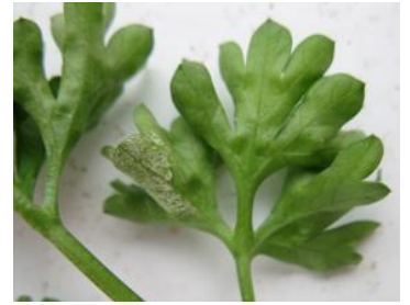
Mildiou sporulant sur persil

Le temps plutôt sec annoncé devrait limiter son développement