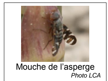
Mouche de l'asperge

Le seuil est atteint dès la constatation de sa présence. Sa présence est à surveiller sur les premières et deuxièmes pousses. La période sensible pour la plante se situe entre le stade pointe et le stade début de ramification.