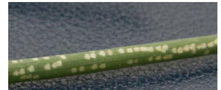
Piqûres de nutrition sur ciboulette

Des larves sont présentes au sein des poireaux. Les infestations peuvent osciller de 10% à 20% des plantes.