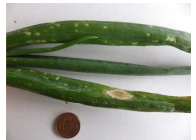
Taches blanches ovales de cladosporiose sur oignons jours courts

Des symptômes de la maladie ont été détectés sur des cultures semées en septembre 2014 ; sur oignons blanc botte à St Benoît sur Loire (45), sur oignons jours courts à Coudray et St Péravy la Colombe (45), à respectivement 20%, 16% et 68% de plantes présentant des symptômes.