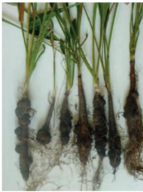
Symptômes de galles dues à Meloidogyne chitwoodi sur salsifis – scorsonères – Photos 3 et 4