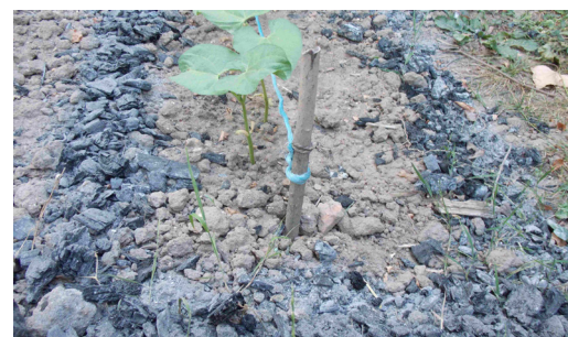
Protection cendre de bois autour culture - Fredon Centre