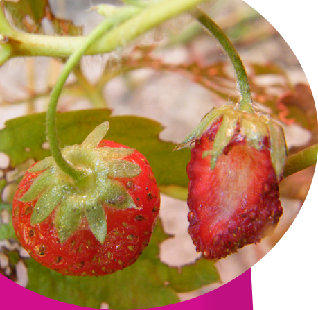
Dégâts et mucus de Limace sur fraise - Fredon Centre