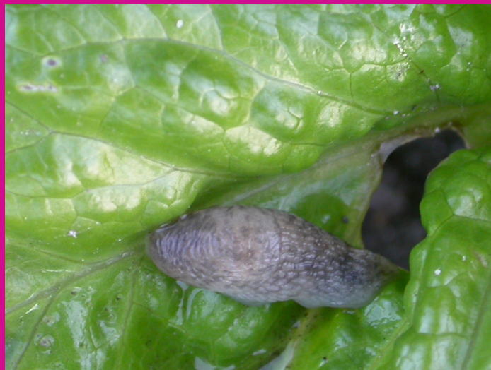
Dégâts de Limace sur salade - Fredon Centre

2 périodes à risque : au printemps mais surtout en automne. La grosse limace et la petite limace grise consomment plutôt les plantes à la surface du sol et semblent attirées par des plantes déjà endommagées. En période de sécheresse, les petites limaces vivent plutôt dans le sol et grignotent alors les parties souterraines des plantes, notamment les racines charnues, bulbes et tubercules. Ces limaces s'attaquent à de nombreuses espèces de plantes, elles ont un régime très varié. Elles sont capables d'évaluer à distance la qualité, la quantité et le stade des plantes qu'elles ont à disposition ainsi que leur accessibilité.