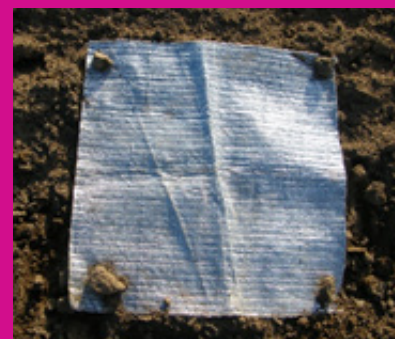
Piège à limace - Fredon Centre

Suivez nos observations en vous abonnant gratuitement aux BSV légumes ou aux BSV ZNA.