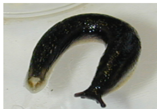
Limace horticole - Fredon Centre