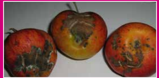
Tavelure sur pommes

Sur mes pommiers et mes poiriers, les feuilles et les fruits sont d'abord tachés, puis des croûtes liégeuses apparaissent sur les fruits qui finissent par se craqueler.