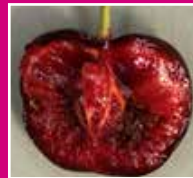
Dégât sur fruit D Susukii

Plusieurs asticots difficiles à voir à l'œil nu. Le fruit ramollit très vite. D'autres fruits rouges comme les fraises, framboises, et mûres peuvent être touchés.