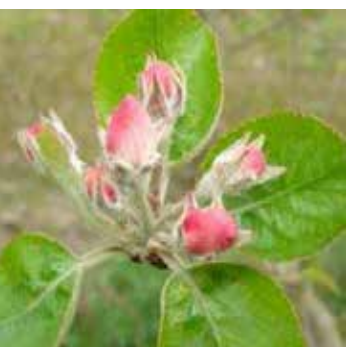
Stade E2 « Avant fleur »