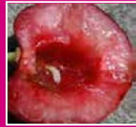
Asticot de Rhagoletis cerasi dans fruit

En général, un asticot par cerise bien visible.