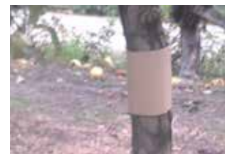
Bande carton ondulé