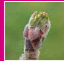
Pommier : Stade C «Eclatement des bourgeons»