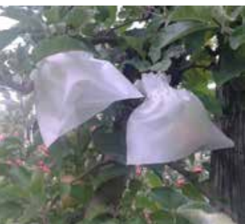
Fruits ensachés - ©Coveta

Conférence Président Héron Harrow sweet Angély