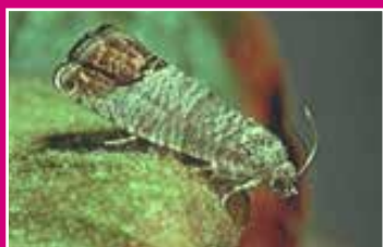
Papillon de carpocapse

Les dégâts sont causés par la chenille d'un papillon, le carpocapse des pommes et des poires (Cydia = Laspeyresia pomonella) qui peut également être présent sur noyers, cognassier, pruniers et abricotiers.