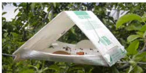
Piège à carpocapse