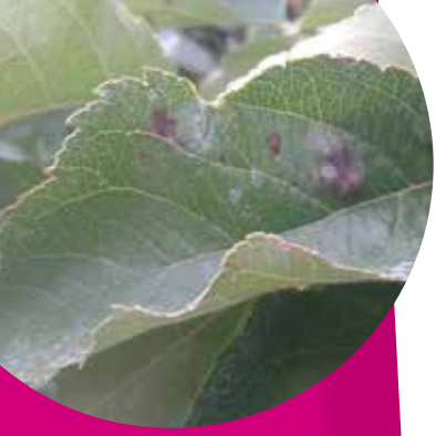
Tavelure sur feuille