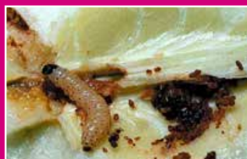
Chenille de carpocapse

Les dégâts sont causés par la chenille d'un papillon, le carpocapse des pommes et des poires (Cydia = Laspeyresia pomonella) qui peut également être présent sur noyers, cognassier, pruniers et abricotiers.