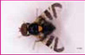
Adulte de Rhagoletis cerasi