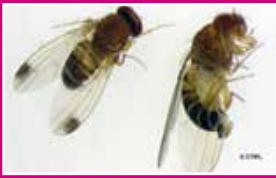
Adultes de Drosophila suzukii

Rhagoletis cerasi : Confirmer le diagnostic à l'aide de pièges de couleur jaune à installer mi- mai côté midi. Cette technique de piégeage peut permettre de limiter les populations de mouches à condition de multiplier les pièges dans l'arbre (3 à 5 pièges au minimum). Mais lorsque la pression du ravageur est trop forte, le piégeage peut s'avérer insuffisant.