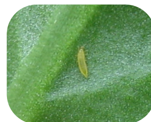
Larve de thrips