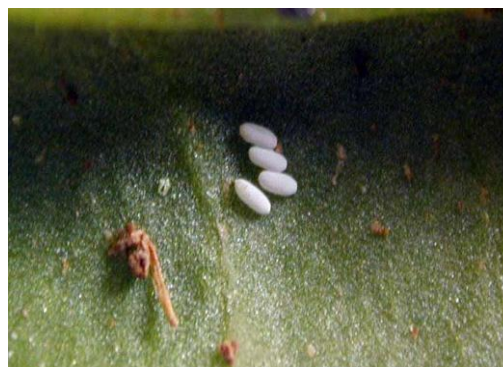
Ponte sous une feuille