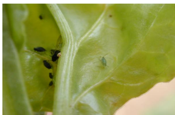
Pucerons ailés noirs et verts – aptères noirs

Dans les parcelles avec des traitements de semences IMPRIMO ou CRUISER aucune intervention ne se justifie .