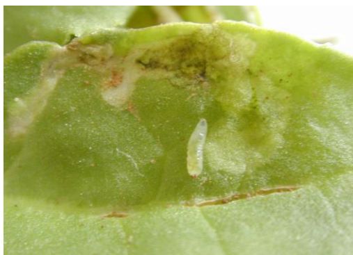
Mines de pégomyies avec présence de larve

Avant couverture du sol, le seuil de nuisibilité est atteint dès l'observation des premières galeries (mines) sur au moins 10 % des plantes .