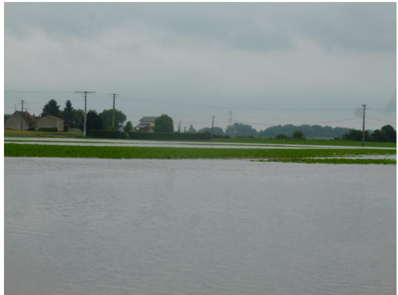
Parcelle de betteraves – 01/06/2016 – Secteur Mareau aux Bois

Plus de 500 ha de betteraves se trouvent actuellement submergés. Des expériences similaires attestent que la culture peut supporter sans dommage une immersion de 7 à 10 jours si le sol draine correctement et que la structure n'est pas dégradée au retrait de l'eau.