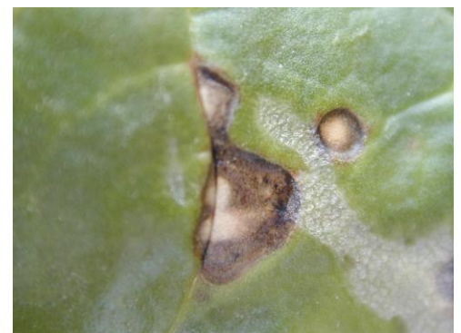
Tâche de pseudomonas

Il s'agit de tâches difformes plus ou moins foncées qui apparaissent en bord de feuille et qui ne peuvent en aucun cas être confondues avec de la Cercosporiose.